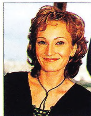
Patricia Kaas, chanteuse.