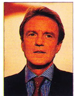
Bernard Kouchner, médecin, fondateur de Médecins du monde, ancien ministre.