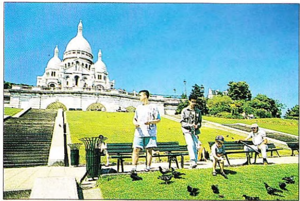
La butte Montmartre.